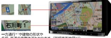
一方通行 ※1 や建物の形状や名前、歩道の有無までわかります。(詳細市街地図 ※2 )

高精細4倍画質VGAモニターで、文字や道路がくっきり。LEDバックライトを採用したワイドVGAモニターを搭載。その精緻な表現力を活かすためのチューニングを施し、瞬時の見やすさを実現しました。