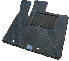
オリジナルフロアマット

L型バイザー(MZ562828) 雨の日の室内換気にも便利です。フロントバイザー後部には「MITSUBISHI MOTORS」のロゴステッカー付き。亚克力製、スモーク。フロント/リヤ左右セット。