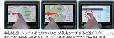
中心付近にタッチするとゆくりと、外側をタッチすると速くスクロール。また目的地をタッチすると、すばやくその場所までスクロールします。

画面にタッチするだけで、地図のスクロールも自由自在。レスポンスが早いので必要な情報をすくに表示することができます。